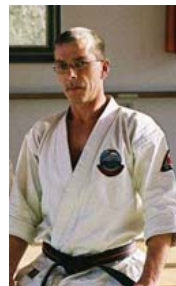
A. Modl 7. Dan